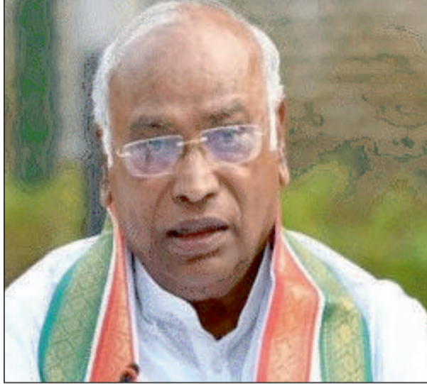
खाई को किया इतना गहरा, जनता ने देखा "अच्छे दिन" का असली चेहरा।

खड़गे ने कहा याद दिलाना जरूरी है कि पिछले 09 सालों के 'मित्र काल' में.. अरबपतियों को मिली ढेरों सौगात, और गरीबों से किया गया सिर्फ विश्वासघात। आर्थिक असमानता की