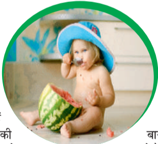
के बारे में।

तरबूज कैल्शियम और मैग्नीशियम का अच्छा स्रोत होता है। ये दोनों ही पोषक तत्व बच्चों की हड्डियों के विकास में मदद करते हैं। जिन बच्चों की हड्डियां कमजोर होती होती हैं उन्हें रोजाना 200 ग्राम तरबूज खाने की सलाह दी जाती है। कैल्शियम जैसा पोषक तत्व होने की वजह से तरबूज दांतों के लिए भी अच्छा होता है।