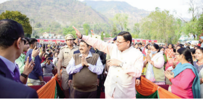
उत्तराखण्ड प्रहरी ब्यूरो

देहरादून। मुख्यमंत्री पुष्कर सिंह धामी ने शुक्रवार को शिव जूनियर हाई स्कूल थेवा, मालदेवता, देहरादून में वर्तमान सरकार के 1 वर्ष पूर्ण होने के अवसर पर आयोजित बहुउद्देशीय शिविर एवं जनसभा को संबोधित करते हुए कहा कि प्रदेश की महान जनता ने इतिहास में पहली बार किसी सरकार को दोबारा सत्ता में लाने का कार्य किया है। उन्होंने कहा कि जन भावनाओं का सम्मान तथा जनता का हित हमारे लिए सर्वोपरि है। मुख्यमंत्री ने कहा कि प्रदेश के विकास हेतु हमारी नीति और नीयत, दिशा और लक्ष्य स्पष्ट है। इस अवसर पर मुख्यमंत्री पुष्कर सिंह धामी ने विभिन्न विभागों द्वारा लगाये गये स्टॉलों का भी अवलोकन किया।