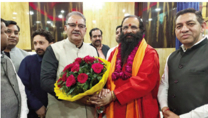
उत्तराखण्ड प्रहरी ब्यूरो